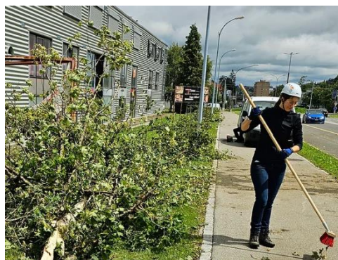
Missions Horizon, La Chaux-de-Fonds, 2023

La remise des dons se fera dans le courant de l'année 2024 par le biais d'une petite cérémonie. Les donateurs et partenaires y seront conviés. Le compte est tenu par la banque CEDC de Cossonay.